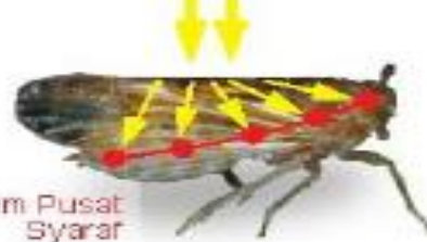
Sistem Pusat Syaraf