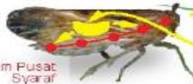
Sistem Pusat Syaraf

Masuk melalui jaringan tanaman yang dimakan oleh hama, yang menyebabkan kelumpuhan, dan akhirnya kematian hama.